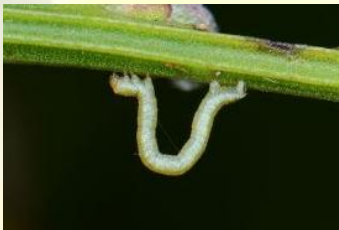
Herfstbremspanner** Chesias legatella Apr-Mei. Jonge rups.