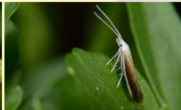
Driekleurige bremkokermot** Coleophora saturatella Juni-juli.