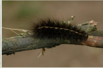
Kleine beer Phragmatobia fuliginosa