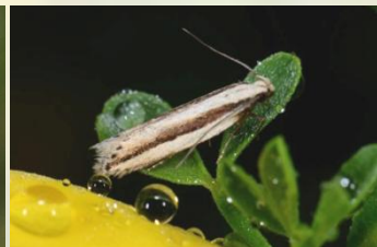
Streephoutmot** Mirificarma interrupta Apr-Jun. Laat zich makkelijk opjagen uit vegetatie.