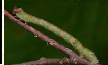
Peper-en-zoutvlinder Biston betularia Sept-Okt