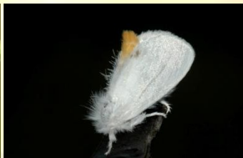
Donsvlinder Euproctis similis Juni-Sept. Vlinders soms overdag te vinden op plant.