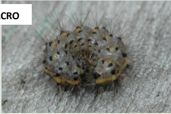
Kleine beer Phragmatobia fuliginosa Jun-Sept. Jonge rupsen kaal en grijs