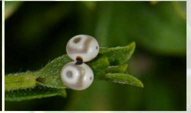
Rietvink Euthrix potatoria Jul-Sept