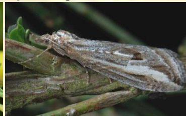
Herfstbremspanner** Chesias legatella Okt-nov. Overdag tegen stam of twijg. Laat zich makkelijk opjagen.