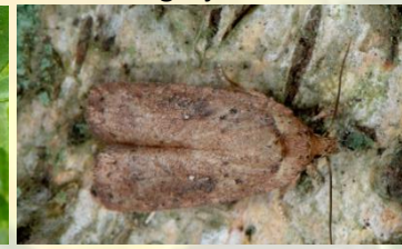
Vale bremkaartmot** Agonopterix scopariella Apr-Okt