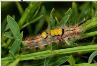
Witvlakvlinder Orgyia antiqua Mei-Sept.