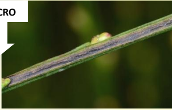
Gewone drievorkmot** Trifurcula immundella Jan-Apr, langgerekte mijn.