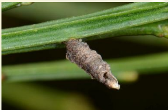
Driekleurige bremkokermot** Coleophora saturatella Jaarrond. Verwarring met Bremkokermot mogelijk (niet afgebeeld)