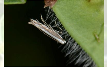
Bremstelmtot** Micrurapteryx kollariella Mei-Aug. Laat zich opjagen.