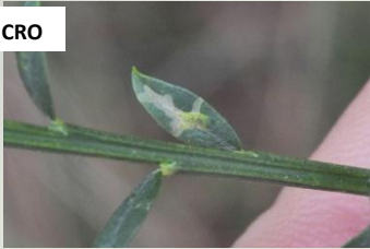
Bremstelmtot** Micrurapteryx kollariella Sept, opvallend 'kruisvormige' mijn in het blad