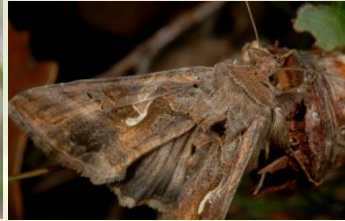
Gamma-uil Autographa gamma Jun-Okt. Ook dagactief. Laat zich ook opjagen.