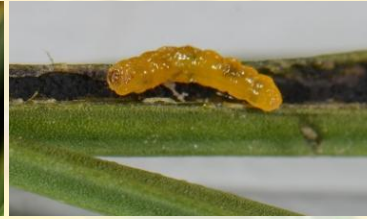
Gewone drievorkmot** Trifurcula immundella Jan-Apr, rups oranje-geel en kwetsbaar.