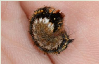
Rietvink Euthrix potatoria Okt-Jun. Jonge rups.