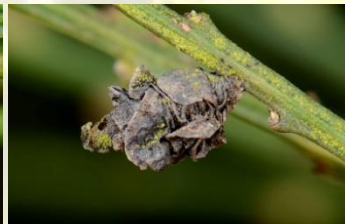
Driekleurige bremkokermot** Coleophora saturatella Jaarrond.