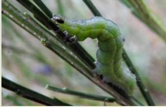
Gamma-uil Autographa gamma Jul-Aug.