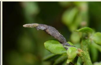
Bezembremkokermot** Coleophora calycotomella Jaarrond