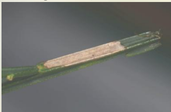
Bremstengelvouwmot** Phyllonorycter scopariella Dec-Jan