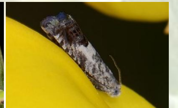
Scherpe spiegelmot** Cydia succedana Mei