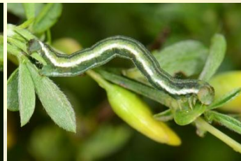
Herfstbremspanner** Chesias legatella Apr-Mei. Verwarring mogelijk met oranje bremspanner