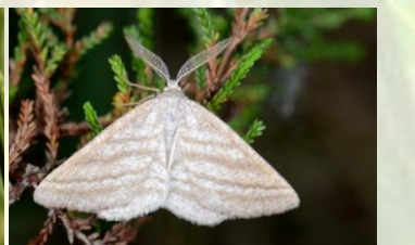
Gestreepte bremspanner Perconia strigillaria Mei-Jun. Dagactief, laat zich makkelijk opjagen.