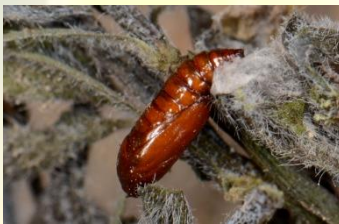
Gele bremkaartmot** Agonopterix assimilella Apr-Aug. Pop in spinselnest.