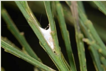
Gele bremkaartmot** Agonopterix assimilella Okt-dec. Vroege spinsels in "frietzakvorm"