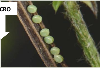
Grijsgroene zomervlinder** Pseudoterpna pruinata Juli-Aug. Solitair of in kleine groepjes afgezet op bladeren en/of stengels.