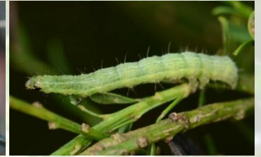
Gamma-uil Autographa gamma Jul-Aug. Let op groen rups met donker masker.