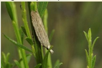
Bremscheutboorder** Anarsia spartiella Jun-Aug. Ook overdag in struik aanwezig.