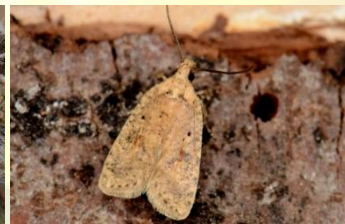
Gele bremkaartmot** Agonopterix assimilella Apr-Aug