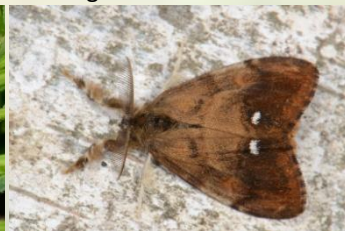
Witvlakvlinder Orgyia antiqua Juli- Nov