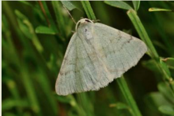
Grijsgroene zomervlinder** Pseudoterpna pruinata Mei-Okt Laat zich soms opjagen.