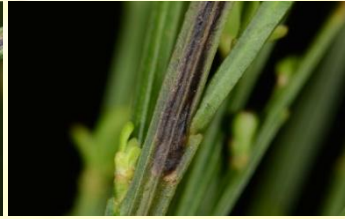
Gewone drievorkmot** Trifurcula immundella Jan-Apr, langgerekte mijn.