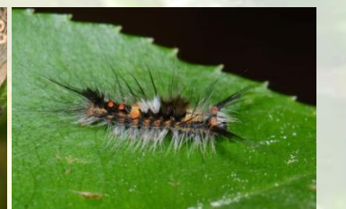
Witvlakvlinder Orgyia antiqua Mei-Sept, Borstels geel of wit