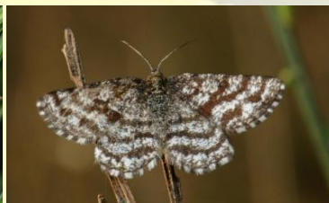
Gewone heispanner Ematurga atomaria Apr-Aug. Dagactief. Laat zich makkelijk opjagen.