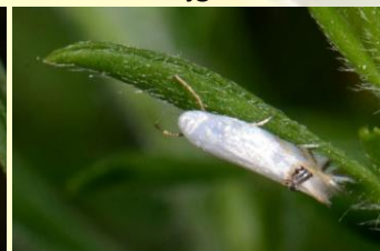
Bremsneeuwmot** Leucoptera spartifoliella Apr-mei. Laat zich opjagen.