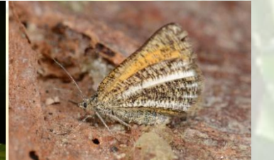
Oranje bremspanner** Isturgia limbaria Mei-Jul. Laat zich makkelijk opjagen.