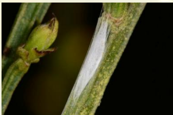
Bremsneeuwmot** Leucoptera spartifoliella Apr-Mei. Cocon zonder lengtestrepen, spits