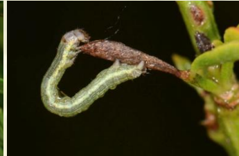
Oranje bremspanner** Isturgia limbaria Jun-Sept