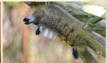
Grauwe borstel Dicallomera fascelina Sept-Jun. Wit-zwarte borstels in alle rupsstadia zichtbaar.