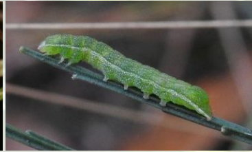
Agaatvlinder Phlogophora meticulosa Nov-Apr