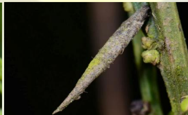
Bezembremkokermot** Coleophora calycotomella Jaarrond