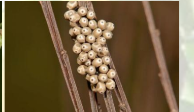
Veelvraat Macrothylacia rubi Mei-Aug