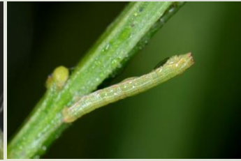
Grijsgroene zomervlinder** Pseudoterpna pruinata Rups jaarrond. Afmetingen variëren van 5 (winter)-30 mm (lente-zomer).