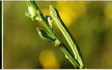
Grijsgroene zomervlinder** Pseudoterpna pruinata Rups jaarrond.