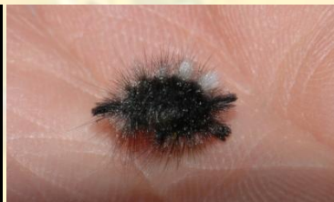
Grauwe borstel Dicallomera fascelina Sept-Jun. Jonge rups.