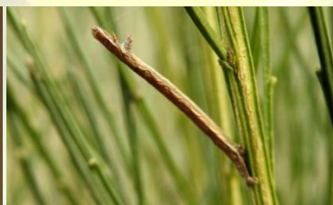
Gestreepte bremspanner Perconia strigillaria Dec-Apr. Vaak "safety-lijn" vanuit kop richting waardplant.