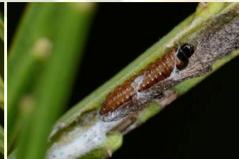
Gele bremkaartmot** Agonopterix assimilella Jan-Mrt. Aanvankelijk bruine, later, donkergroene rups