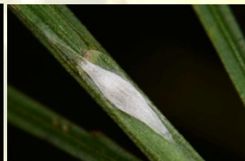
Bremsneeuwmot** Leucoptera spartifoliella Apr-mei