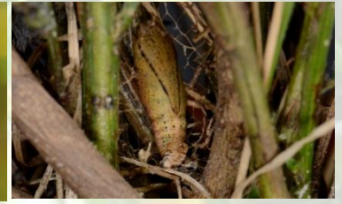
Grijsgroene zomervlinder** Pseudoterpna pruinata Pop juni-juli. Moeilijk vindbaar, in strooisellaag onder waardplant. (groene en bruine variant)