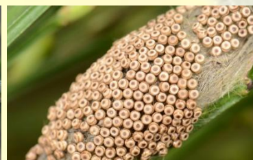
Witvlakvlinder Orgyia antiqua Nov-Apr