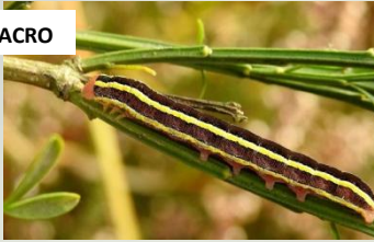
Erwtenuil Ceramica pisi Sept-Okt