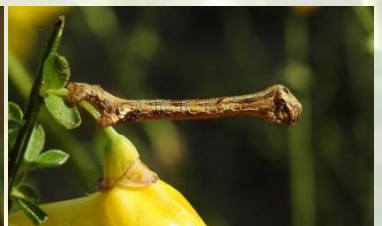
Gewone spikkelspanner Ectropis crepuscularia Mei-Nov