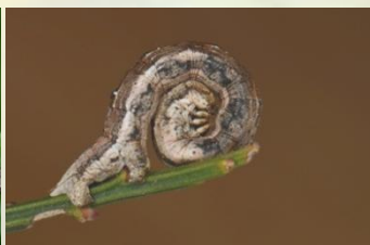
Gestreepte bremspanner Perconia strigillaria Dec-Apr. Lichte lengtestreep vanuit naschuiver lang.