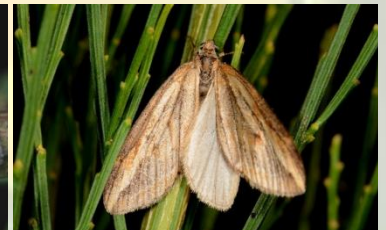
Herfstbremspanner** Chesias legatella Okt-nov.