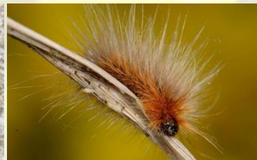
Grote beer Arctia caja Mei-Jun