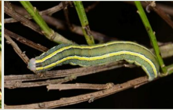
Erwtenuil Ceramica pisi Sept-Okt