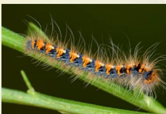
Hageheld Lasiocampa quercus Sept-Jun. Vroege stadia oranje-blauw gekleurd.