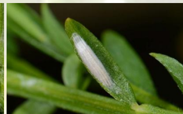
Ooglapmotten / Bucculatrix spec., o.a Eikenooglapmot. Juli- Nov. Cocon met lengtestrepen, stomp uiteinde