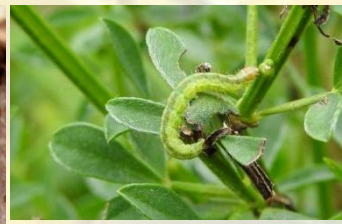
Vale bremkaartmot** Agonopterix scopariella Jun. Los spinselnest tussen meerdere twijgen.