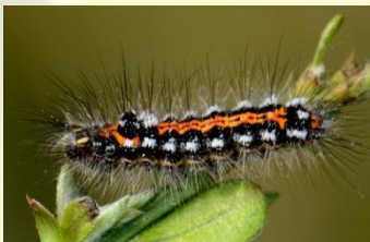
Donsvlinder Euproctis similis Apr-Jun