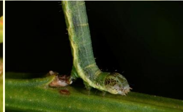
Oranje bremspanner** Isturgia limbaria Jun-Sept. Sterk gelijkend op rups Herfstbremspanner, let op koptekening.