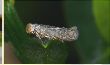
Gewone drievorkmot** Trifurcula immundella Jun-Sept. Soms op waardplant te vinden.