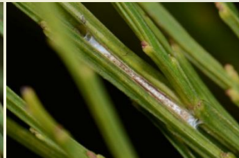
Gele bremkaartmot** Agonopterix assimilella Jan-Mei. Langgerekt spinsel tussen stengels.