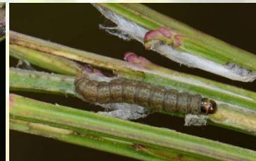
Gele bremkaartmot** Agonopterix assimilella April-Mei. Let op, verwarring met andere micro-rupsen op brem is mogelijk.