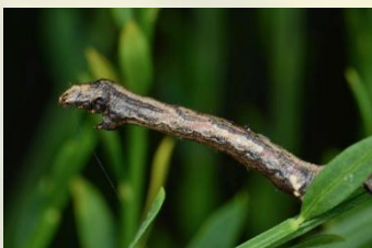
Gewone spikkelspanner Ectropis crepuscularia Mei-Nov. Let op lichte smalle streep bij naschuiver.