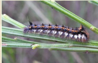
Rietvink Euthrix potatoria Okt-Jun