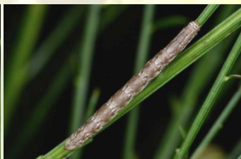
Gewone heispanner Ematurga atomaria Sept