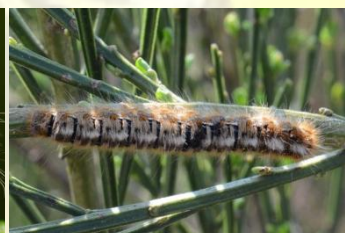
Hageheld Lasiocampa quercus Sept-Jun. Latere stadia overwegend bruin-zwart.