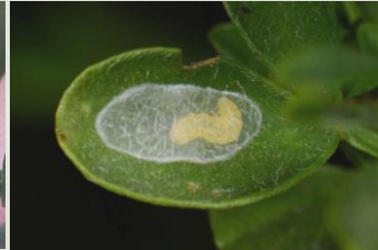
Bremstelmtot** Micrurapteryx kollariella Jun-Jul, inkapseling van rups voorafgaande aan popstadium