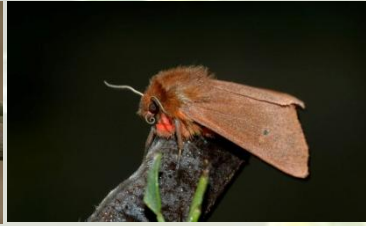
Kleine beer Phragmatobia fuliginosa Mei-Sept. Soms overdag rustend tegen plant