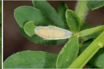
Bremstelmtot** Micrurapteryx kollariella Jun-Jul, inkapseling van rups voorafgaande aan popstadium