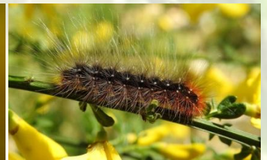
Grote beer Arctia caja Mei-Jun