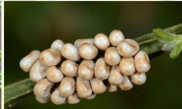
Nachtpauwoog Euthrix potatoria Mei