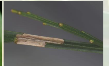
Bremstengelvouwmot** Phyllonorycter scopariella Dec-Jan